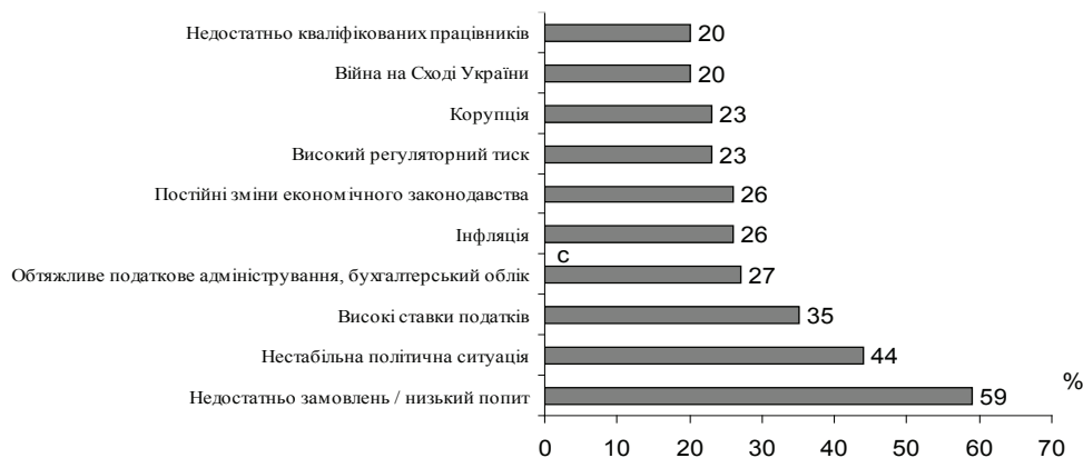
Рис. 1. Основні загрози діяльності для малих і середніх підприємств в Україні (станом на 2016 р.)

Усі ці чинники негативно вплинули на функціонування ринку праці в Україні. Розуміючи вагомість проблеми, вітчизняні підприємства зіткнулися з потребою розроблення нових підходів до організації кадрової безпеки та втримання кваліфікованих кадрів, перед якими відкривається можливість доступу до європейських корпорацій зі значно вищим рівнем оплати праці. Про актуальність проблем із забезпеченістю кадрами свідчать дані Щорічної оцінки ділового клімату в Україні [5], відповідно до якого 20% опитаних представників малих і середніх підприємств (МСП) зіткнулися з проблемою недостатньої кваліфікації працівників (рис. 1).